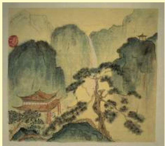
张奉献《青山》绘画类第三名